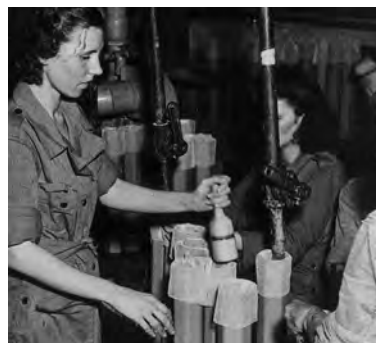
アメリカにおける M69 焼夷弾の生産