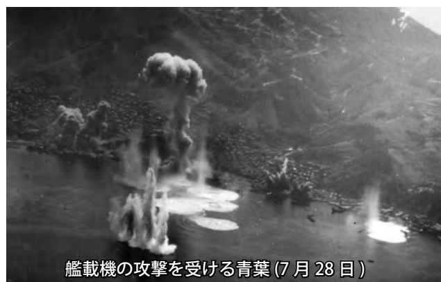
艦載機の攻撃を受ける青葉(7月28日)