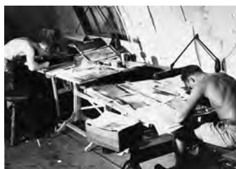
写真偵察機が撮影した写真を判読し分析する作業