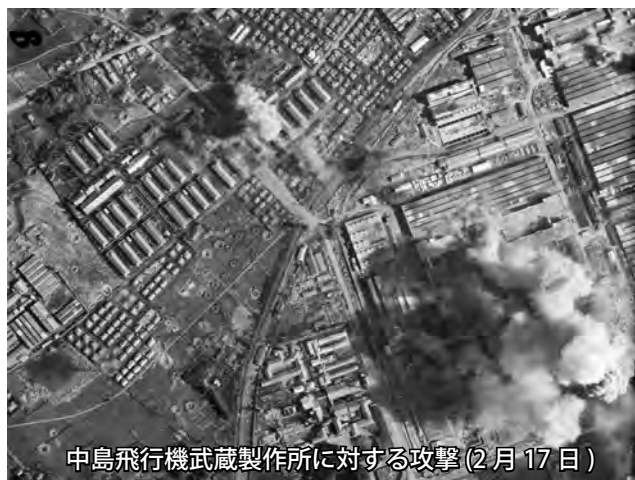
中島飛行機武蔵製作所に対する攻撃(2月17日)

幅 250mm × 高さ 240mm 並製本カバー掛け 221 ページ 定価 2800 円 + 消費税 ISBN978-4-9907248-5-6 2018 年 7 月 27 日発行