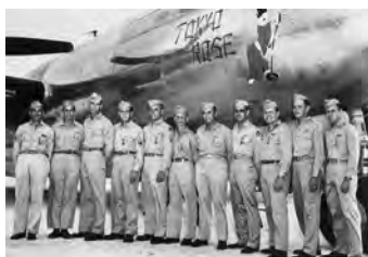
B-29 を改造した写真偵察機 F-13 と東京を偵察した第 3 写真偵察戦隊の隊員