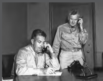
原爆開発を指揮したグローヴズ (左) と副官ファレル (右)