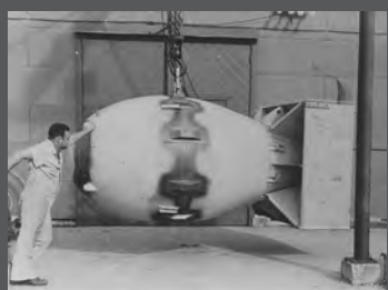
長崎に投下された原爆ファットマン