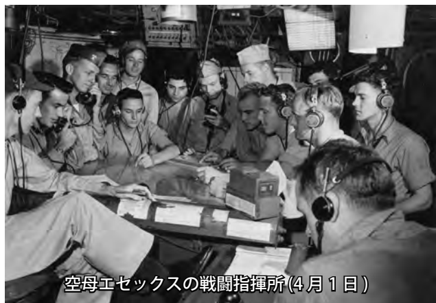
空母エセックスの戦闘指揮所(4月1日)